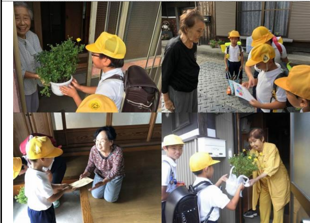
一人暮らしのお年寄りに便りと花の贈呈