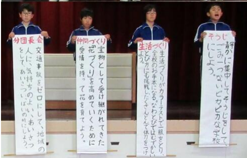
宝物づくりをベースにした 児童会スローガン