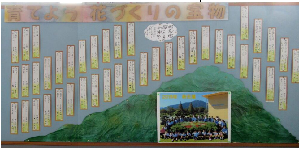
いっぱい咲いた花を見て俳句づくり

児童の積極的な花づくり活動を地域にも広め、PTAや地域の方と連携をして育てた秋花壇、F B C中央審査で岐阜県知事賞を受賞しました！