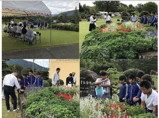
F B C 審査会