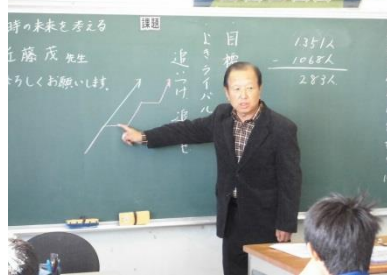
時地区の歴史や思いを聴く