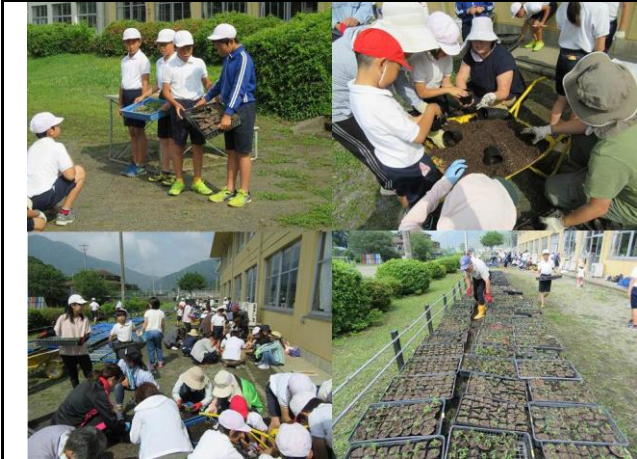
親子ポット詰め作業