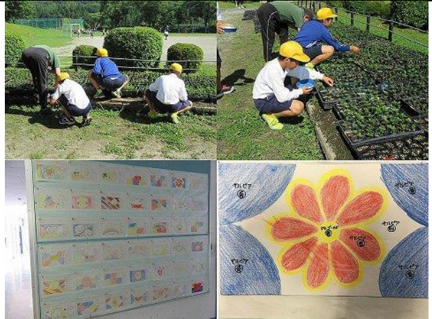
草取りと花壇デザイン募集