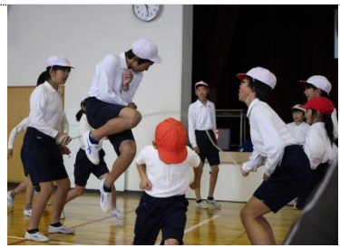
なかよし班の大縄跳び