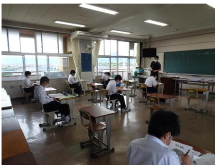
1年生の教室の様子

学校再開にあたり行った分散登校では、「新しい生活様式」に馴染めるように「3密（密集・密接・密閉）の回避」を意識して学校生活を送りました。