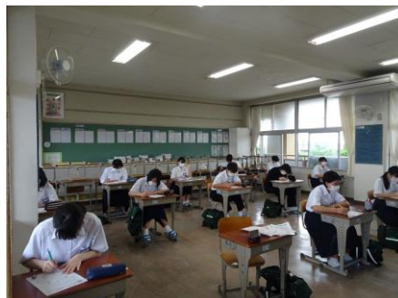
2年生の教室の様子