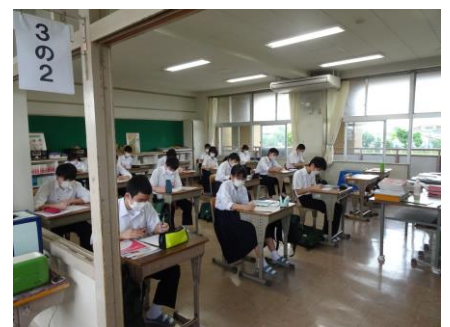
3年生の教室の様子