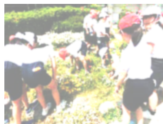
草引きボランティアの様子

先週は、環境委員会が休み時間に花壇の草引きボランティアを全校に呼びかけました。そのときには30人以上の子が手伝っていました。こうして、委員会活動でも全校を巻き込みながら自主的な取り組みが見られるようになってきています。