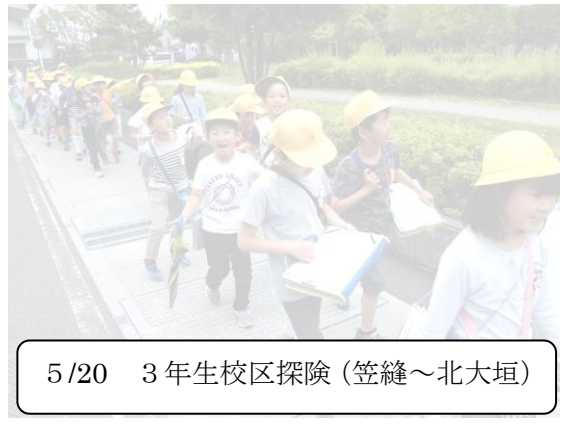
5/20 3年生校区探険(笠縫～北大垣)