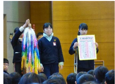
各学級の成果の発表の様子