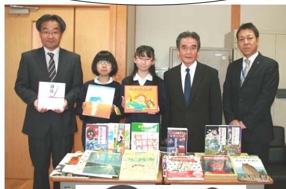
牧田小学校へ 寄付していただきました