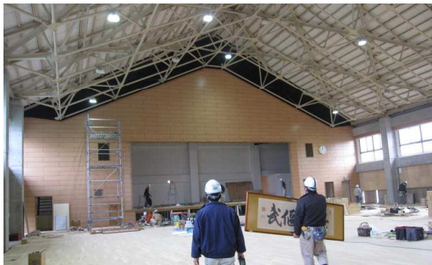
興文小学校 屋内運動場 平面図

かつて旧講堂は、大垣藩校120周年の折りに建設され、50年もの間、多くの同窓生の方々が、興文小の思い出や伝統を築いてこられました。