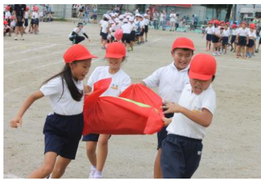
2年 野菜運びリレー

「うんどうかい、がんばったよ！」 うんどうかいのチェッコリ玉入れでは、なんかいい玉をひろって、いっぱいいれました。 クラスのうんどうかいリーダーとして、クラスのみんなをならべせたり、こえをかけたりにしてがんばりました。 (1年児童)