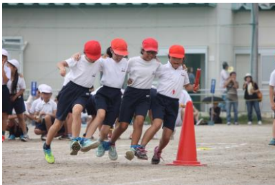
5年 結んでつないでGo!

「運動会でがんばったこと」 わたしが運動会でがんばったことは2つあります。一つ目はつなひきです。仲間と力を合わせてがんばり、ならぶ時はしずかにならび作戦に向かってがんばりました。二つ目は応援です。じゅんばんをまちがえてしまったけどあきらめずに全力の声がだせたのでよかったです。 (4年児童)