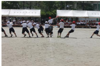
4年 走れつかめ 勝利のつな

「声をいっぱい出して がんばった運動会」 一番良かったと思うのは台風の目です。本番で初めて白が1位をとれたからです。80m走は3位でくやしかったです。がんばっている人を大きな声でおうえんしている人がいて、やさしいなと思いました。 (3年児童)