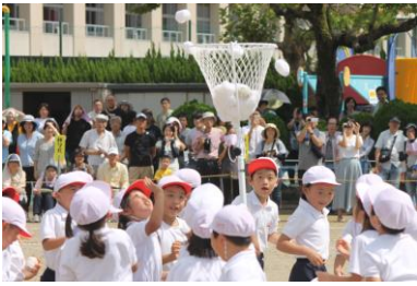
1年 チェッコリ玉入れ

天候の影響で、今年の運動会は16日実施となりましたが、温かなご声援ありがとうございました。子どもたちの振り返りや感想の一部を紹介します。