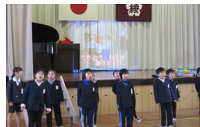
【「6年生を送る会」に向けて(1年)】

「6年生を送る会」(3月2日)に向けた準備が本格化してきました。名称は「6年生を送る会」ではありますが、綾里小の伝統を引き継ぐ会ですので、どの子にとってもこれまでの足跡を振り返り、今後の成長のための決意をもつ機会となります。特に、5年生にとってはこの日を境に、実質的に最高学年となり、気持ちが引き締まることと思われま。各学年で工夫を凝らした出し物を発表しますので、たくさんの保護者の皆様の参観をお待ちしております。